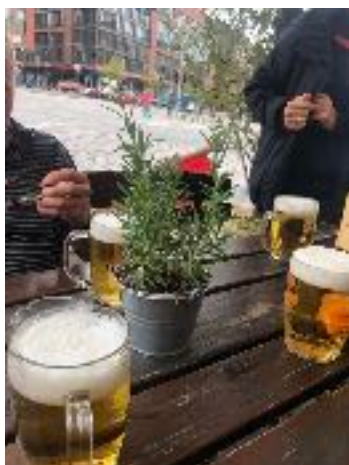
Frokost i Hamburg

Midt i september var vi otte bjørne der mødtes under uret på Københavns Hovedbanegård en tidlig tirsdag morgen. Udrustet med pladsbilletter, og lidt, men ikke for meget, proviant, fandt vi det direkte tog til Hamburg. Fire timer senere var vi på Hamburg Hauptbahnhof. Vi havde bestilt værelser på A&O hotel Hamburg Hauptbahnhof, som vel måtte ligge lige ved stationen. Det lå dog ikke lige ved, men en pæn gåtur væk. Navnet tjener vel til at få togrejsende gæster. Det bedste ved hotellet var morgenmaden. Den var god og rigelig. Værelserne til gengæld var temmelig små, og de andre gæster var hovedsagelig meget unge folk og skoleklasser på udflugt i Hamburg. Men morgenmaden var god! Eftermiddagen blev brugt til at finde et sted til frokost. Igen langt at gå, og derefter