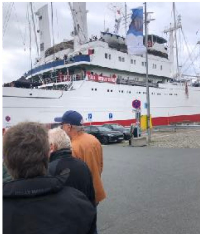
Venter på at komme ombord i Rendsburg

Næste morgen skulle vi være på den centrale busterminal kl. 8. Her holdt der seks turistbusser, der alle skulle til Rendsburg med passagerer til Cap San Diego, som vi skulle sejle med gennem Kielerkanalen, gennem sluserne ved Brunsbüttel og videre op ad Elben til Hamburg. Cap San Diego ligger normalt fast som museumsskib i Hamburg havn.