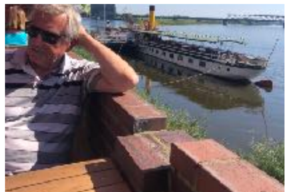
Her ses Kaiser Wilhelm i Lauenburg