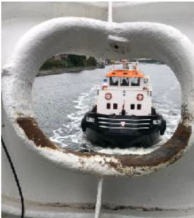
Vores medfølgende slæbebåd

følgeskab af en slæbebåd fra Kiel gennem Kielerkanalen. I Elben blev den skiftet ud med en fra Hamburg. Sejlturen gennem kanalen var meget smuk, og i Elben hvor farten blev sat op begyndte det at mørkne, så vi kom frem til lysene i Hamburg i mørke. At få lov at gå rundt overalt på det store skib