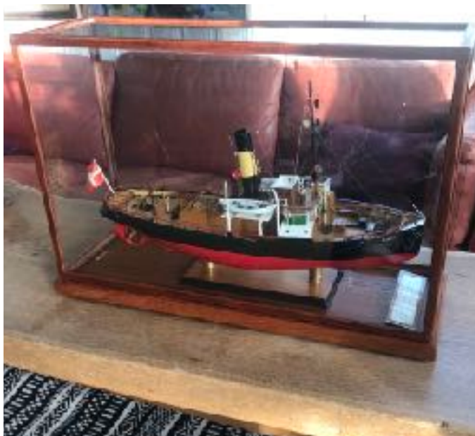
Bjørn i montre