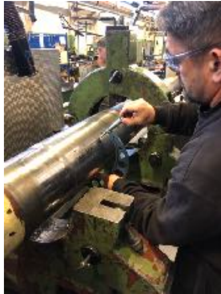
Skrueakslen måles i drejebænken

forsynet med et 800mm langt stævnør af kunststof. Skrueakslen blev bragt til "Hundested Propeller" til afdrejning af lejesæderne. Her konstaterede man, at akslen under lejesæderne var sprøjtetøbt med hårdtmetal, som nu løsenede sig fra underlaget.