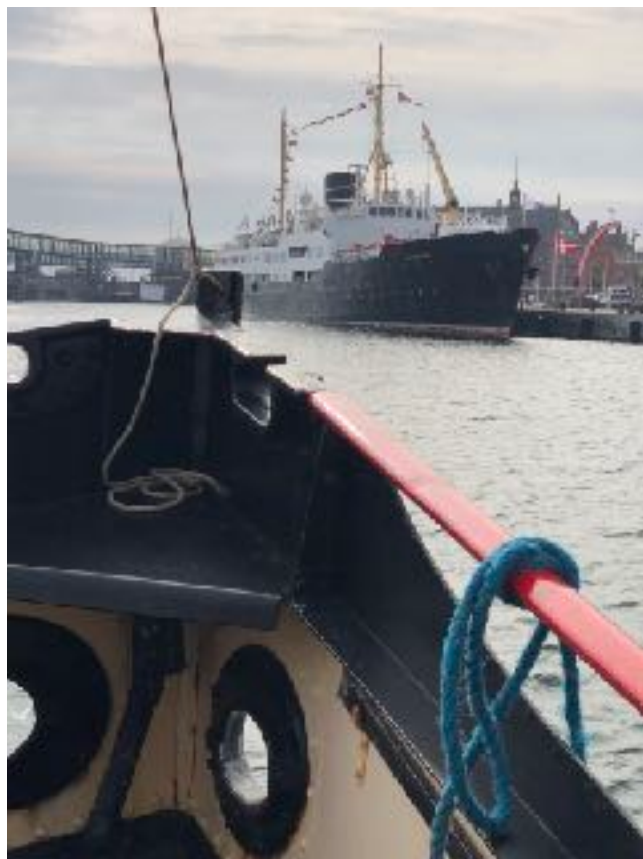
M/S Nordstjernen i Helsingør

Der blev aftalt to ture og aldrig har der været så mange store fotoapparater med ombord på SS Bjørn. Vejret var fint på begge ture.