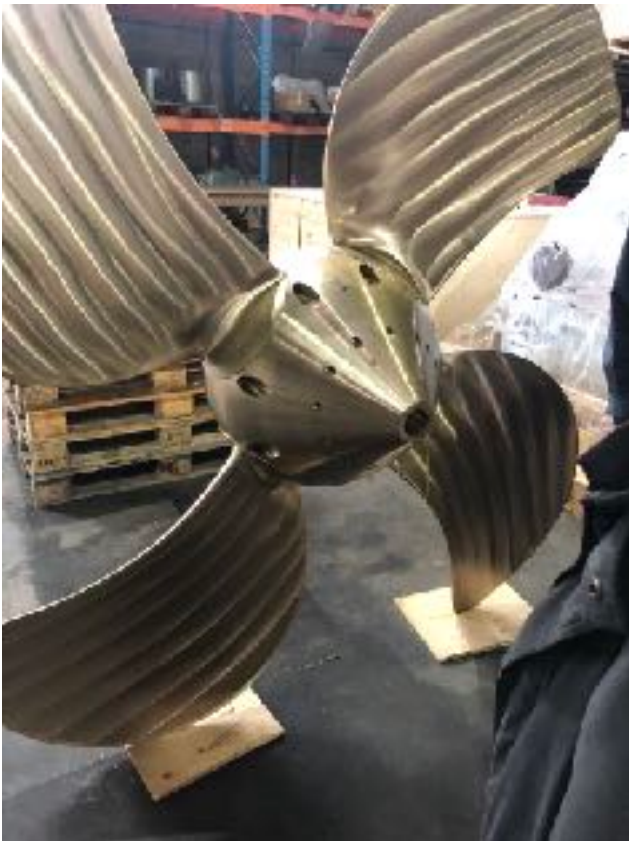
Propeller, fremstillet i Hundested