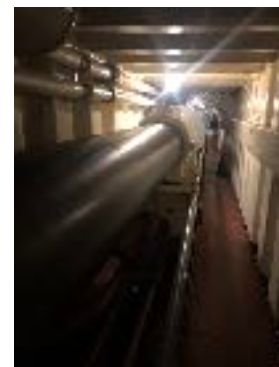
En velvoksen skrueaksel

blot forkert dato og klippede billetterne. Han havde prøvet dette mange gange før. Hjemme torsdag aften var alle trætte, men enige om at dette havde været en god oplevelse.